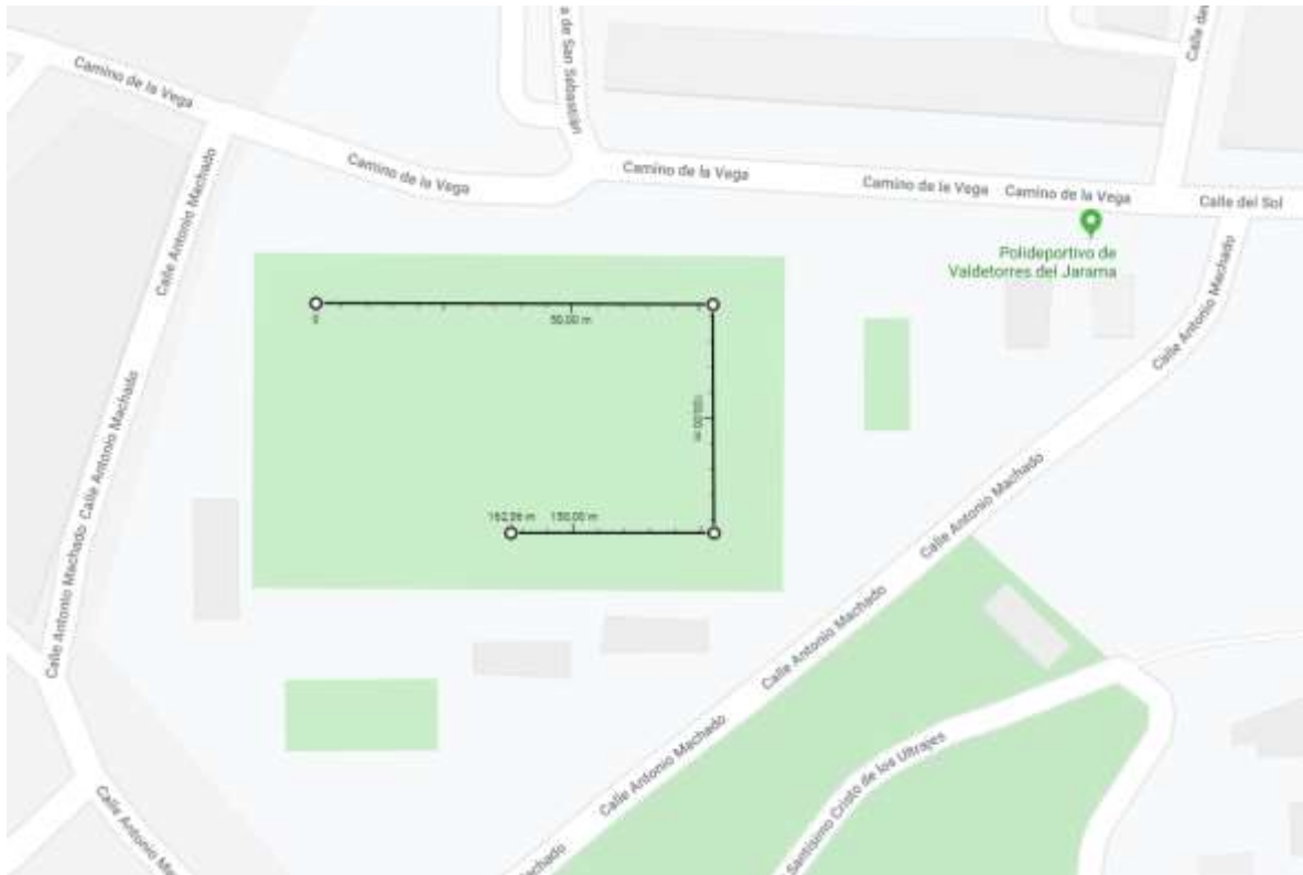
Ilustración 3 Carrera 0,15 km