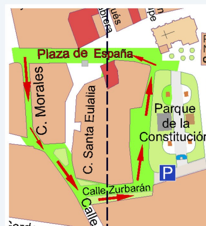
PEQUES 2010 y posterior. 500 metros.